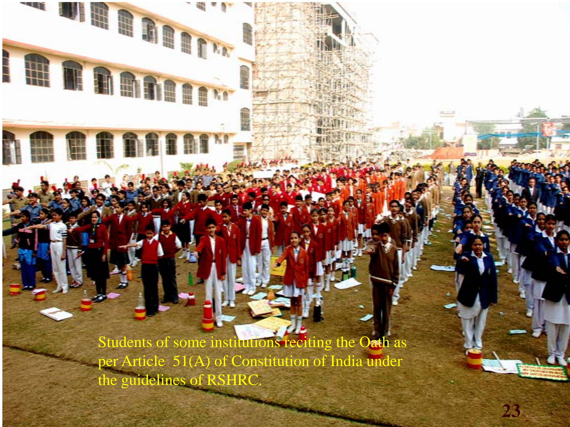
Students of some institutions reciting the Oath as per Article 51(A) of Constitution of India under the guidelines of RSHRC.