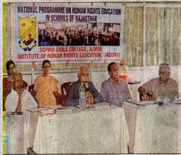
सोफिया कॉलेज में आयोजित बैठक में भाग लेते अतिथि।