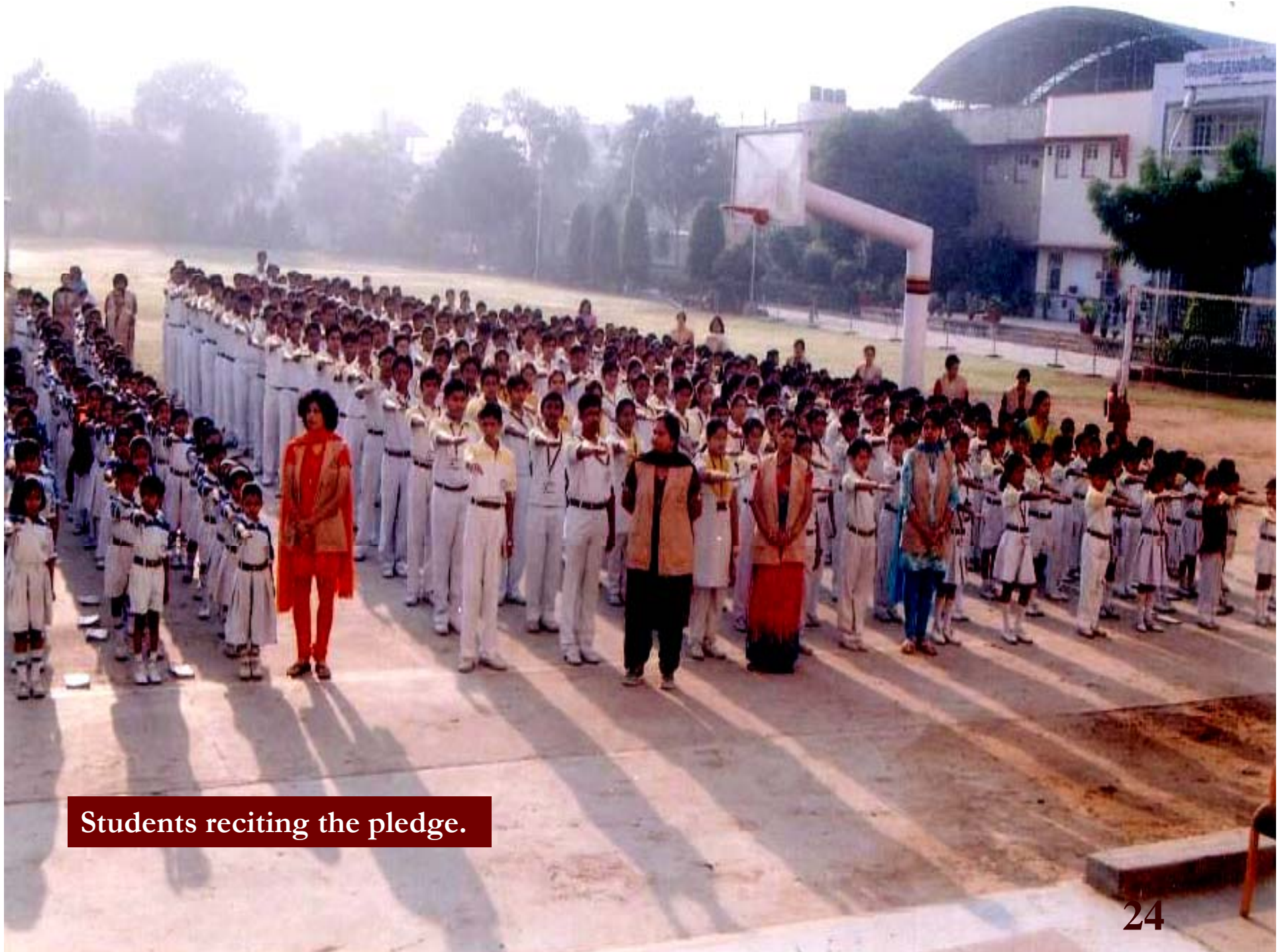
Students reciting the pledge.